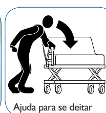
Ajuda para se deitar