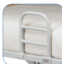
Pega de apoio (disponível como acessório)