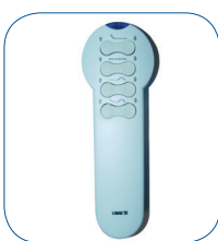
2 comandos à distância por infravermelhos (opcional).