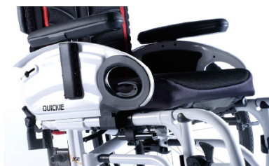
XFF04000x Apoios de braço de escritório