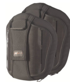
Torácico Médio (MT)