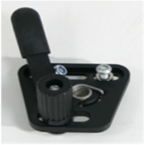
XFF060001 Travão standard