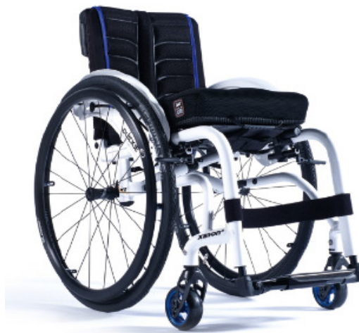
XFF090020 / 21 Estrutura híbrida reforzada