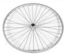
XFF070002 Rodas traseiras de desenho