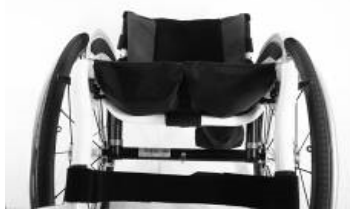
XFF 020003 Tecido do assento com 2 bolsas