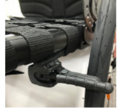
XFF060024 Travão compacto ligeiro EVO