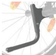
XFF090001 Ajuda p/subir passeio