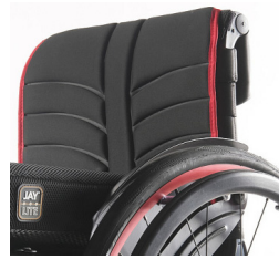
XFF 030316 Tecido do encosto EXO EVO