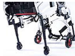
XFF090010 Rodas de trânsito