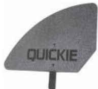
XFF040107 Protector de plástico desmontável