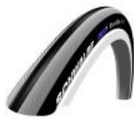
XFF070101 Pneus Alta pressão lisa Right Run