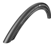
XFF070107 Pneus Schwalbe One