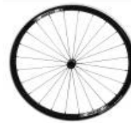
XFF07000 Rodas Proton (ultraligeiras)