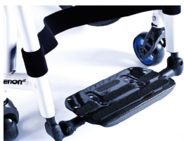
XFF0500132 Plataforma única de fibra de carbono