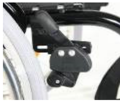
XFF060002 Travão de rodilha (montado alto)