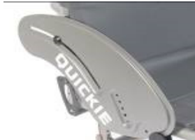
XFF040102 Protector lateral de alumínio sem guarda lamas