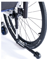
XFF090004 Rodas antivolteio rebativeis