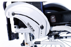
XFF040103 Protector lateral de alumínio com guarda lamas