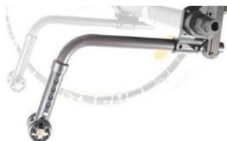
XFF090050 Rodas antivolteio não rebativeis