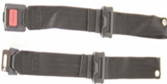
XFF 090018 Cinto de posicionamento com fecho