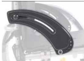
XFF040101 Protector simples pequeno