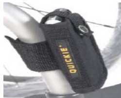
XFF090026 Suporte telemóvel