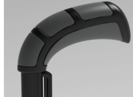
XFF 030201 Punhos standard largos