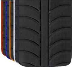
Cores frisos tecidos EXO EVO