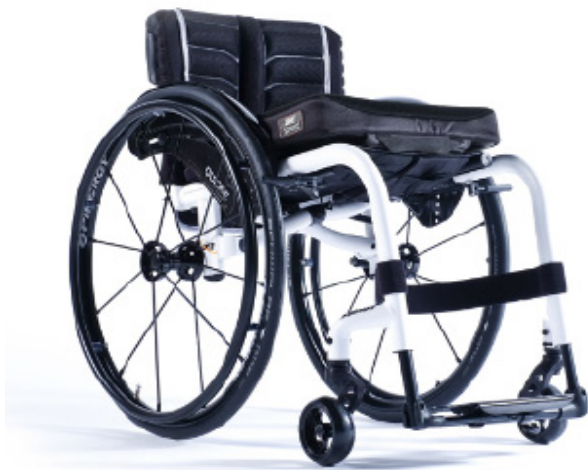
XFF010012 / 13 Armação com apoios de pés fixos