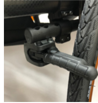
XFF060023 Travão compacto EVO