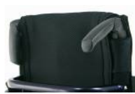
XFF 030203 Punhos dobráveis