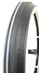
XFF070208 Aros Maxgrepp