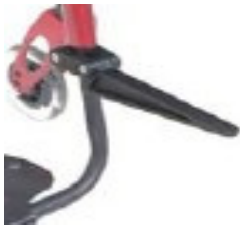
XFF090019 Suporte malas