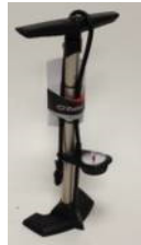
XFF090024 Bomba alta pressão