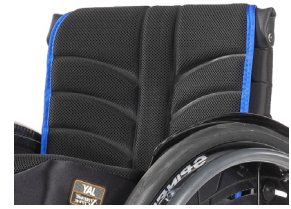
XFF 030317 Tecido do encosto EXO EVO PRO