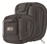
Torácico Inferior (LT)