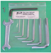
XFF090000 Kit de ferramentas