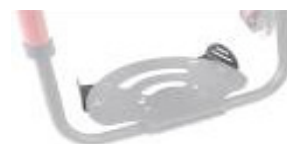
XFF050127 Posicionadores de pés para plataforma