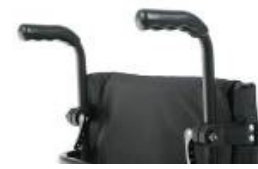
XFF 030204 Punhos ajustáveis em altura