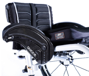
XFF040104 Protector lateral de carbono com guarda lamas