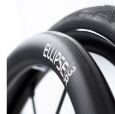
XFF070212 Elipse 3R