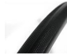
XFF070102 Pneus maciças