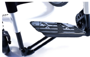
XFF050027 Plataforma auto-dobrável de carbono