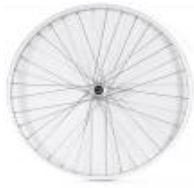
XFF070001 Rodas traseiras com raios cruzados