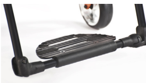
XFF050059 Plataforma de alumínio Xenon performance