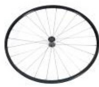
XFF070003 Rodas traseiras ligeiras