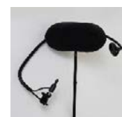
1288, 1289, 2229