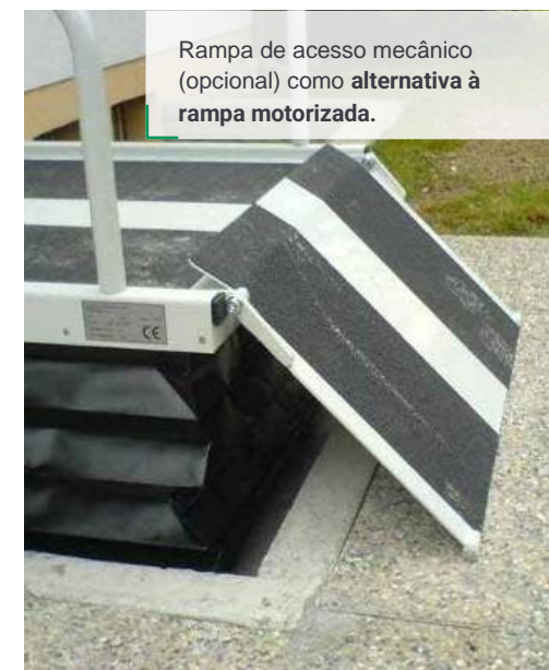
Rampa de acesso mecânico (opcional) como alternativa à rampa motorizada.