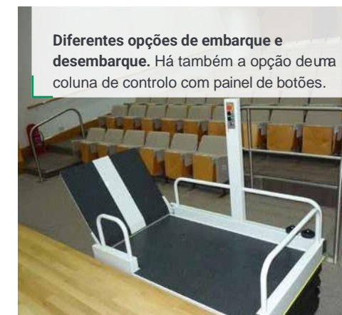
Diferentes opções de embarque e desembarque. Há também a opção de uma coluna de controlo com painel de botões.