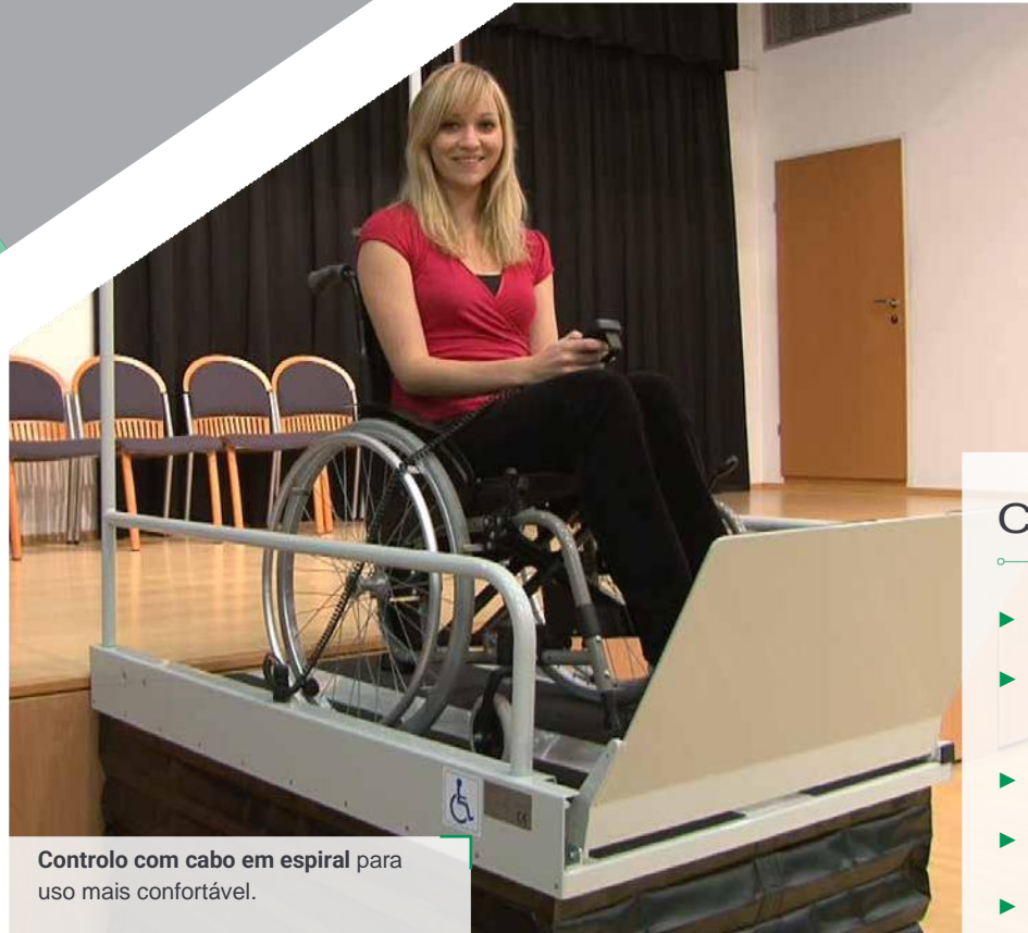
Controlo com cabo em espiral para uso mais confortável.

Prazo de entrega imediato para o modelo standard