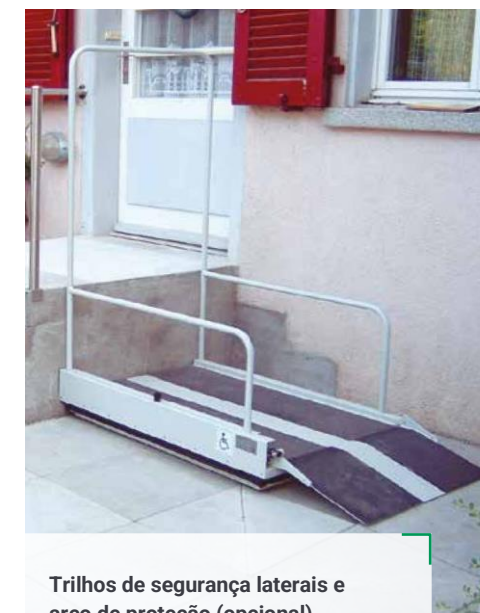
Trilhos de segurança laterais e arco de proteção (opcional)