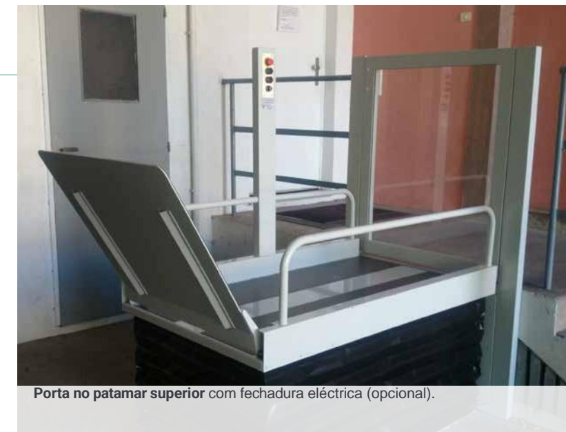
Porta no patamar superior com fechadura eléctrica (opcional).